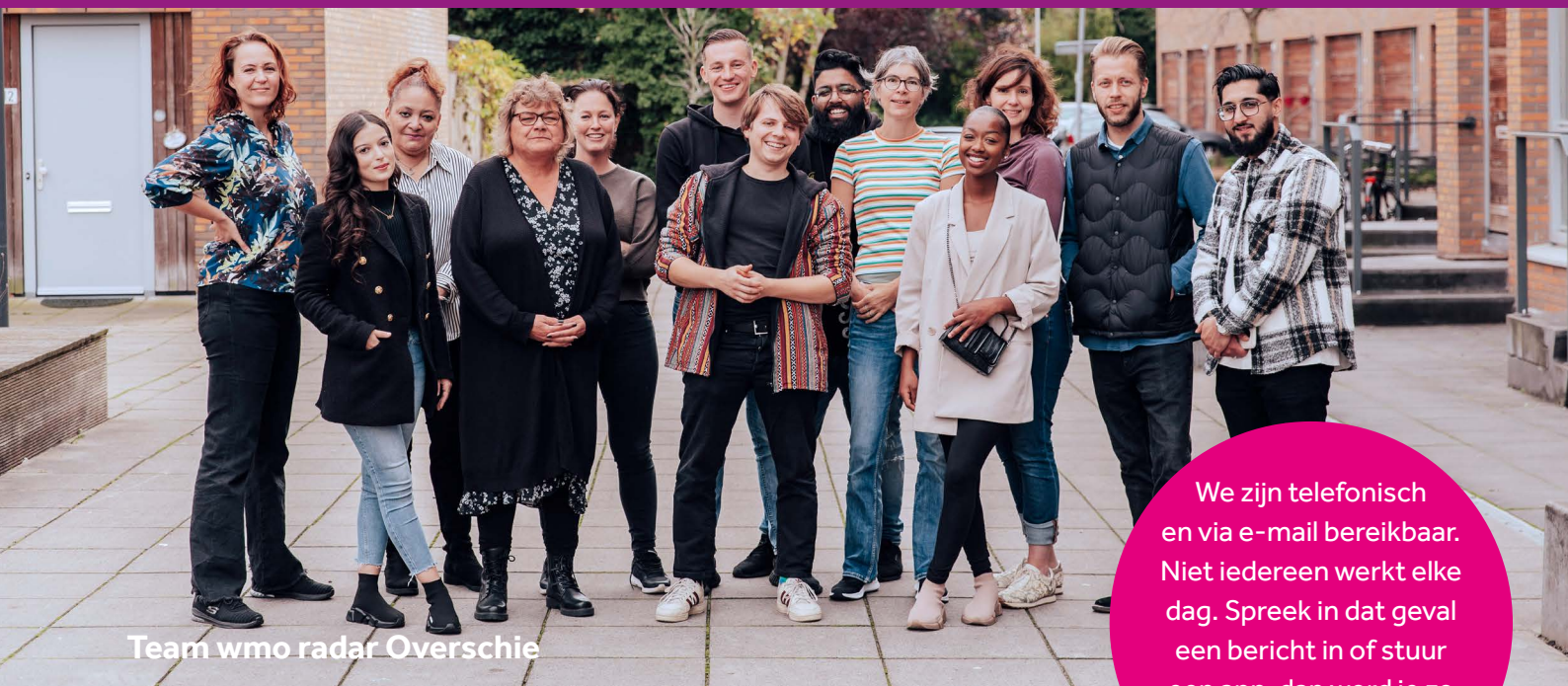
Team wmo radar Overschie

We zijn telefonisch en via e-mail bereikbaar. Niet iedereen werkt elke dag. Spreek in dat geval een bericht in of stuur een app, dan word je zo snel mogelijk teruggebeld.